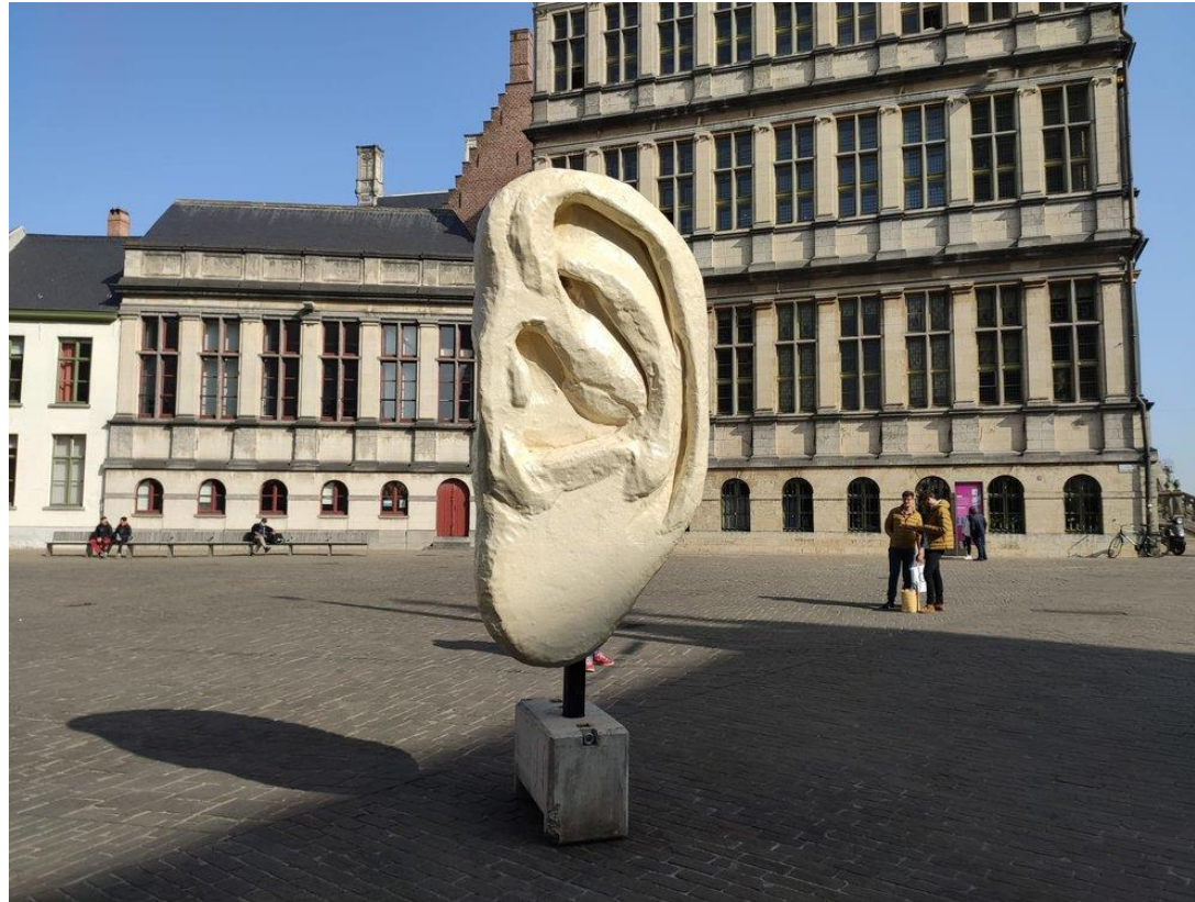
'Luisterend oor' – ombudsdienst Stad Gent